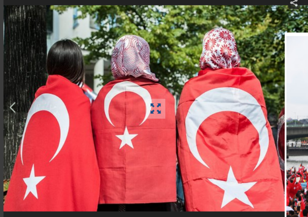
Turkische Demo in Berlin