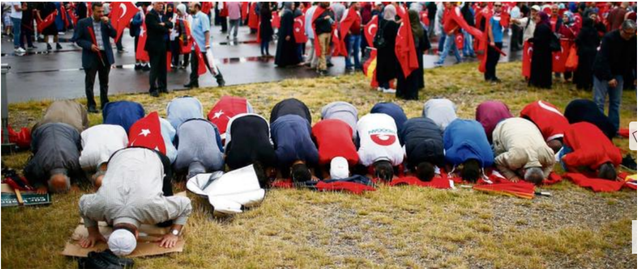
Unterwürfig. Je mehr Macht Staatschef Erdogan an sich reit, desto mehr wird er von seinen Anhangern verehrt.