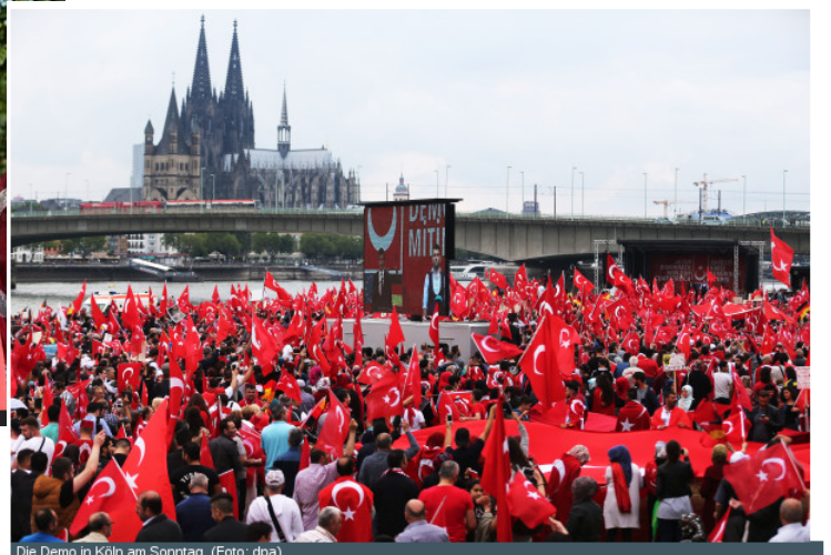
Die Demo in Koln am Sonntag.