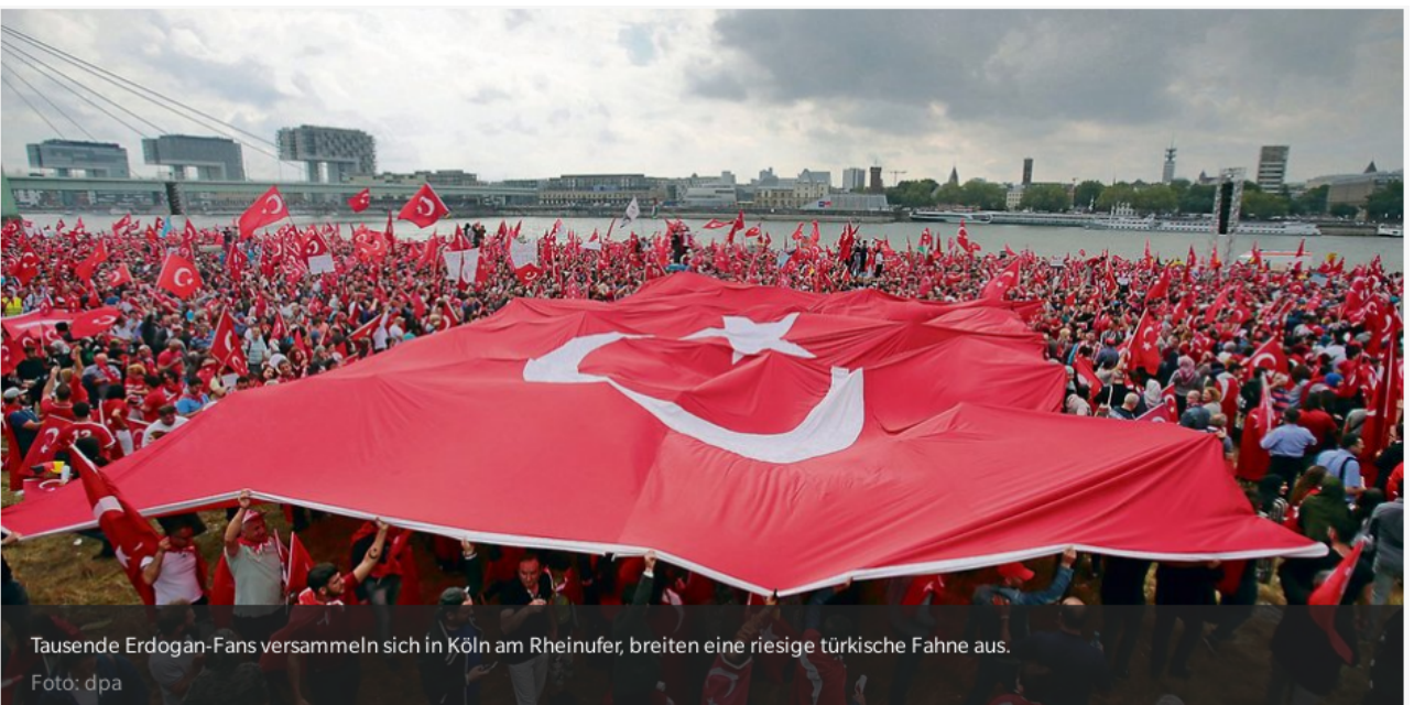
Tausende Erdogan-Fans versammeln sich in Koln am Rheinufer, breiten eine riesige turkische Fahne aus.